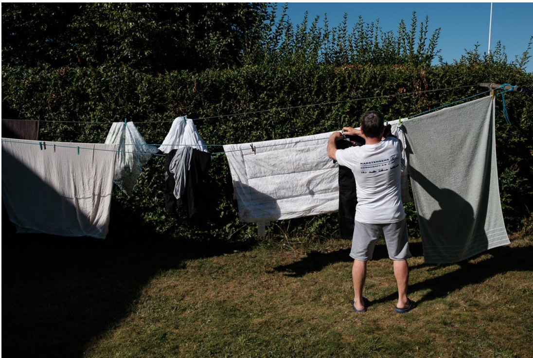
Curtea casei în care sunt cazați electricienii români de la șantierul naval Karstensens, Skagen, Danemarca. Un muncitor român își pune hainele la uscat.