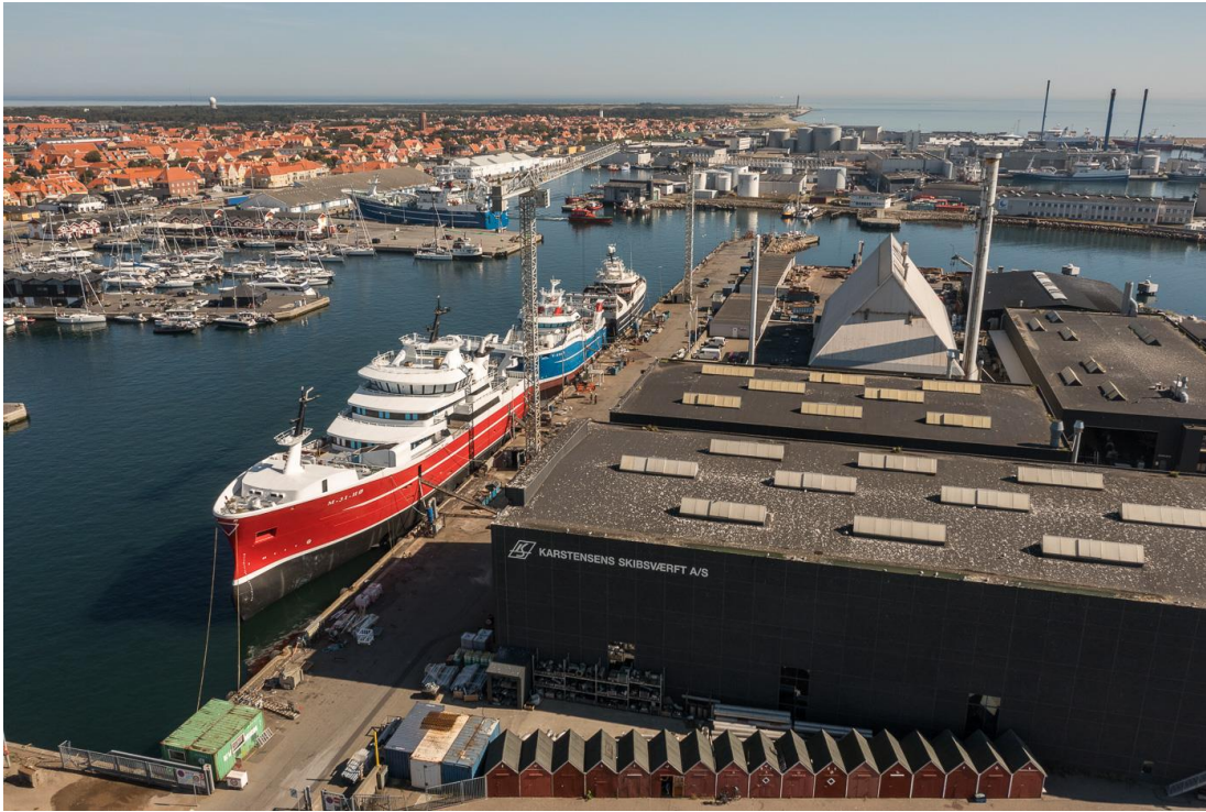
Șantierul naval Karstensens, Skagen, Danemarca