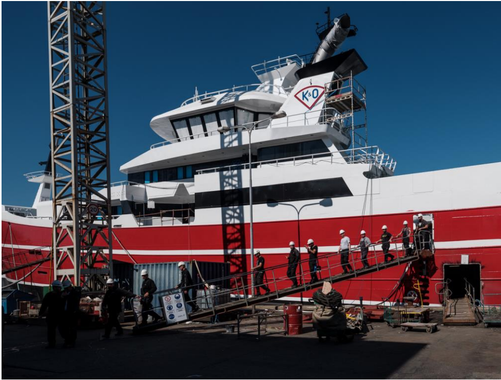
Electricieni români coboară de pe vas la încheierea programului de lucru. Șantierul naval Karstensens, Skagen, Danemarca