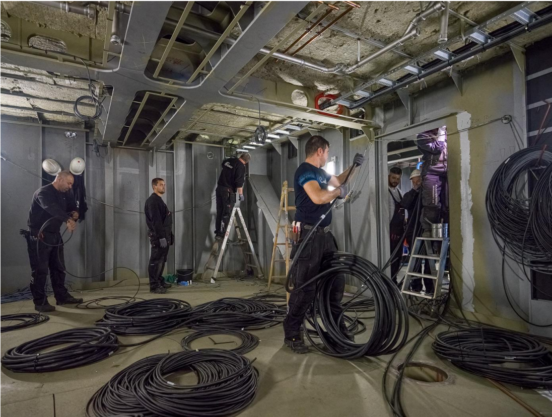
Electricieni români în șantierul naval Karstensens, Skagen, Danemarca