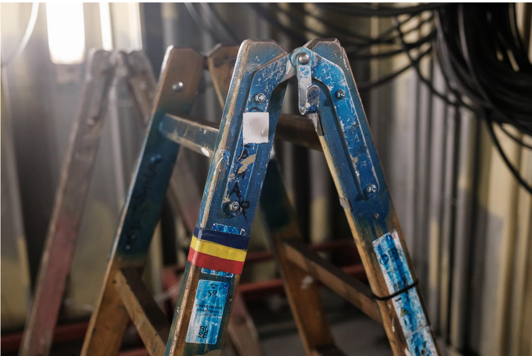
Detaliu în șantierul naval Karstensens. Skagen, Danemarca