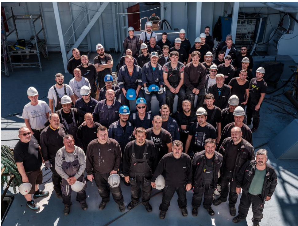
O parte din echipa de 80 de electricieni navali români. Cei care lipsesc din imagine erau în concediu în România sau lucrau pe vapoare în altă parte a portului. Șantierul naval Karstensens, Skagen, Danemarca