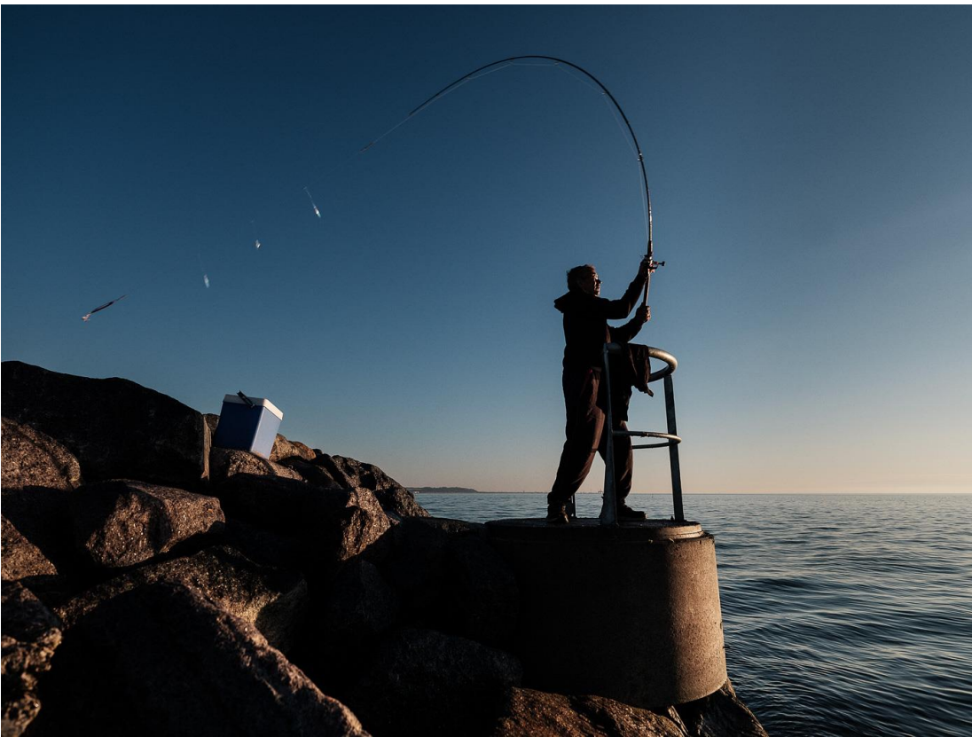
Dorel la pescuit în Sæby, Danemarca