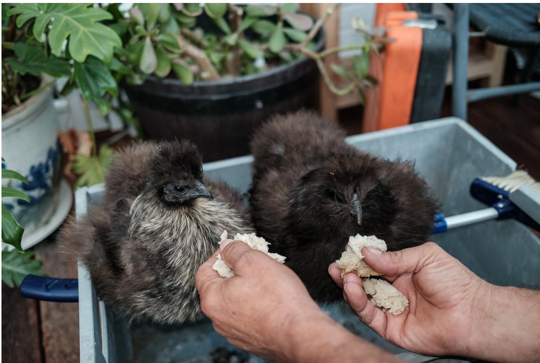
Dorel hrănește găinile din rasa silkehøns pe terasa casei lor din Frederikshavn, Danemarca