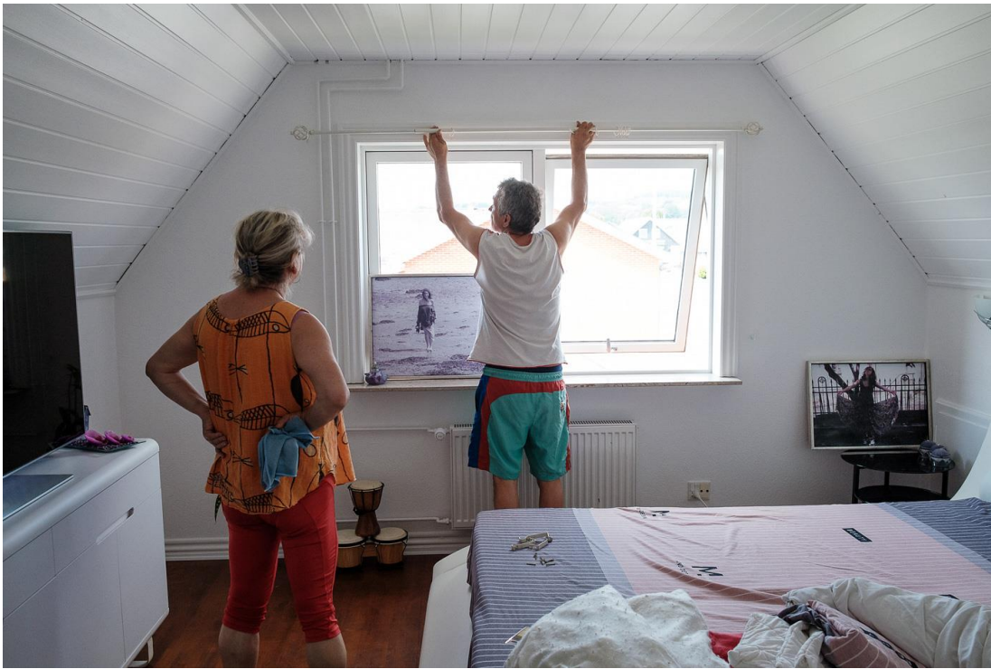
Dorel montează galeria pentru perdea, Frederikshavn, Danemarca